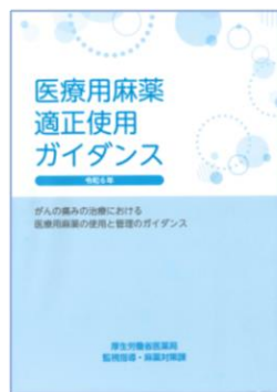
改訂医療用麻薬適正使用ガイダンス