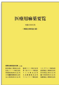
医療用麻薬要覧R6年版