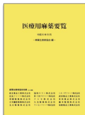
医療用麻薬要覧R6版