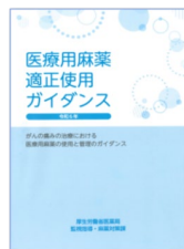
改訂医療用麻薬適正使用ガイダンス