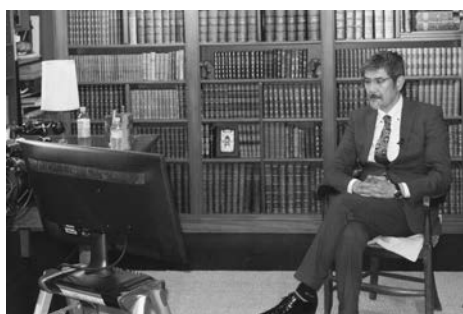
動画収録中、セットバックは書棚

今年、文科省は中学生のスマホや携帯の学校への持ち込みについて、原則禁止を11年ぶりに見直し、大阪府では生徒たちによるスマホの利点や危険性について話し合いの場が持たれるなど、情報ツールとの上手な付き合い方を考えていく方向へのシフトが進んでいます。