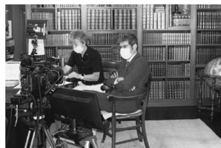
マスク着用、距離を置いて原稿チェック

大人への入り口年齢であり、情報吸収力の豊かなデジタルネイティブ世代の行動変容に繋げることを企画のテーマに設定しました。